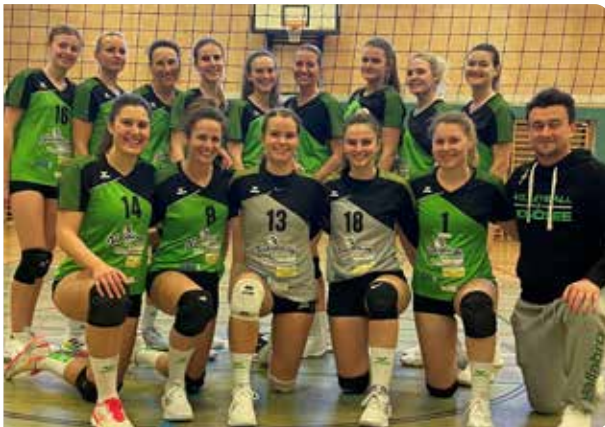
Das Landesliga-Team verpasste den Sprung ins Final Four nur knapp.

Mit vier Volleyball-Mannschaften (U16, U 18, U20 und Damen) stehen die Naturfreunde Mondsee im Meisterschaftsbetrieb. Das U18-Team darf sogar mit der Teilnahme an der Österreichischen Meisterschaft liebäugeln.