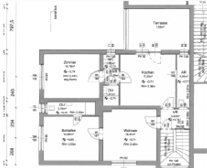
Grundriss der Gemeindewohnung.

Die Wohnung im ersten Obergeschoß des Gemeindehauses ist ca. 80 Quadratmeter groß und umfasst vier Zimmer sowie zwei Sanitärräume. Auch eine Terrasse (17 m 2 ) ist Teil des Mietobjekts. Zur monatlichen Miete (€ 800, exkl. Betriebskosten) kommen Auslagen für die Verwaltung in Höhe von ca. € 20 pro Monat. Die Abrechnung für Wasser, Kanal- und Müllabfuhrgebühr erfolgt separat. Beheizt wird die Wohnung mit Strom, die Kosten sind vom Mieter/von der Mieterin direkt mit dem Energieversorgungsunternehmen abzurechnen. Der Mietvertrag ist befristet auf drei Jahre. Bewerbungen sind bis spätestens 22. April 2024 an die Gemeinde Innerschwand am Mondsee, Wredeplatz 2, 5310 Mondsee (innerschwand@mondseelandgemeinden.at) zu richten. Für Fragen steht Bürgermeister Hans-Peter Pachler (0664 9974530) zur Verfügung.