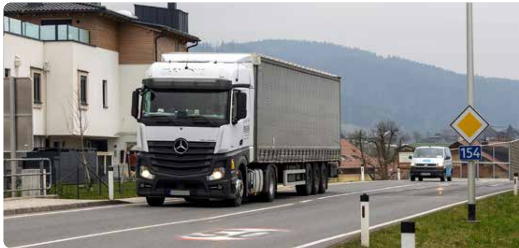
Die Mondsee Bundesstraße wird in der zweiten Aprilhälfte saniert.

Nach Fertigstellung ist die B 154 mit Ausnahme des Abschnitts Straßenmeisterei bis Kreisverkehr Eurospar erneuert; ein Zeitpunkt für die Sanierung dieses Teils ist noch offen. Laut Straßenverwaltung hängt der Startschuss der Bauarbeiten davon ab, wie dieser Streckenabschnitt künftig verkehrstechnisch gestaltet wird (Lackner-Kreuzung, Billa-Kreuzung).