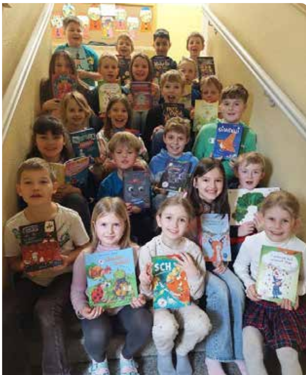
Die Schülerinnen und Schüler freuen sich über die neuen Bücher, die mit den Spenden aus der Weihnachtsfeier finanziert wurden.