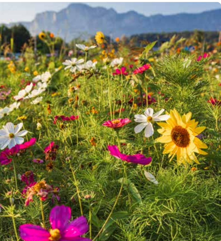
Das Blumenmeer am Kreisverkehr.

Eine Möglichkeit, ohne eigenes Auto mobil zu sein, bietet das Postbus Shuttle, das seit eineinhalb Jahren im Mondseeland unterwegs ist und bereits mehr als 10.000 Fahrgäste befördert hat. Das Shuttle ist barrierefrei und dank Babyschale und Kindersitz für Menschen jeden Alters geeignet. Und für den Vierbeiner gibt's eine eigene Hundebox.