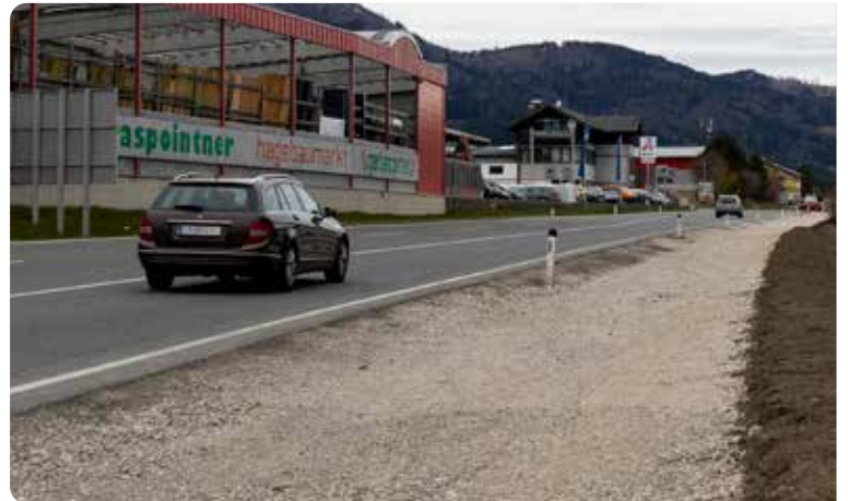
Der Radweg entlang der B 154 soll vor dem Sommer für den Verkehr freigegeben werden.

Zuletzt wurde an der Errichtung des Retentionsbeckens gearbeitet, nach den Feiertagen wird gegrädert, zudem werden die Absturzsicherungen angebracht. „Zeitgleich werden entlang des Weges und auch auf der gegenüberliegenden Seite Bäume gepflanzt“, berichtet Straßenmeister Kurt Aschenberger. Bis Ende Mai soll die Asphaltdecke aufgetragen sein, im Juni die Freigabe für den Radfahrverkehr erfolgen.