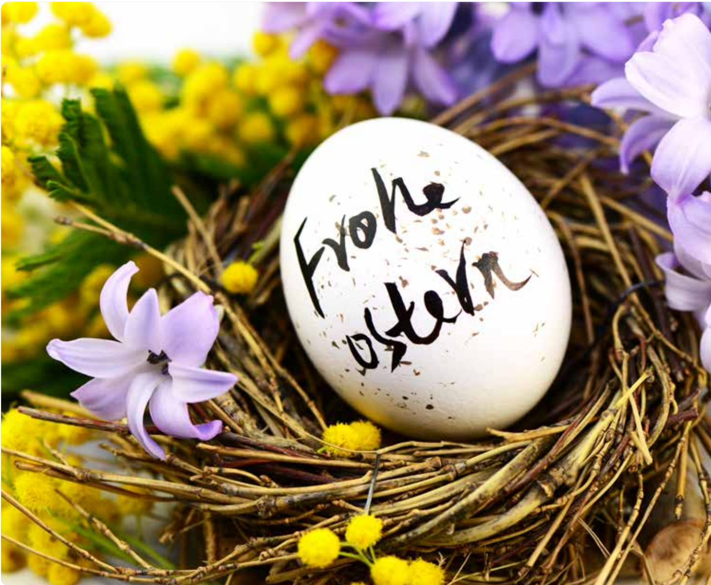
Bürgermeister, Gemeindevertretung und Bedienstete wünschen allen Leserinnen und Lesern ein Frohes Osterfest.

Die B 154 in Tiefgraben ist in den nächsten Monaten verkehrstechnisch ein Brennpunkt: Im April starten die Arbeiten für die Sanierung der Fahrbahn zwischen dem Lagerhaus und Zell am Moos. Über zwei Wochen ist die Straße nur in eine Richtung befahrbar, am 1. Mai ist eine Totalsperre geplant, um die Asphaltierung durchzuführen. Noch bis Ende Mai dauern die Arbeiten am Radweg vom Gewerbegebiet bis zum Billa-Kreisverkehr an, ab Juni ist der Weg für Radfahrer offen. Berichte Seite 3 und 7