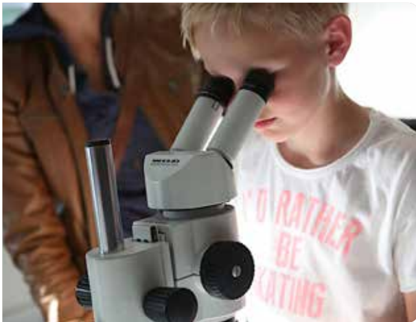
Neues entdecken beim Blick ins Mikroskop.

Mikroskopieren, Erbsubstanz gewinnen oder zum Echoloten mit dem Boot auf den Mondsee: All das und mehr gibt es bei der Langen Nacht der Forschung am Freitag, 24. Mai, 17 - 23 Uhr, im Institut für Limnologie zu entdecken.