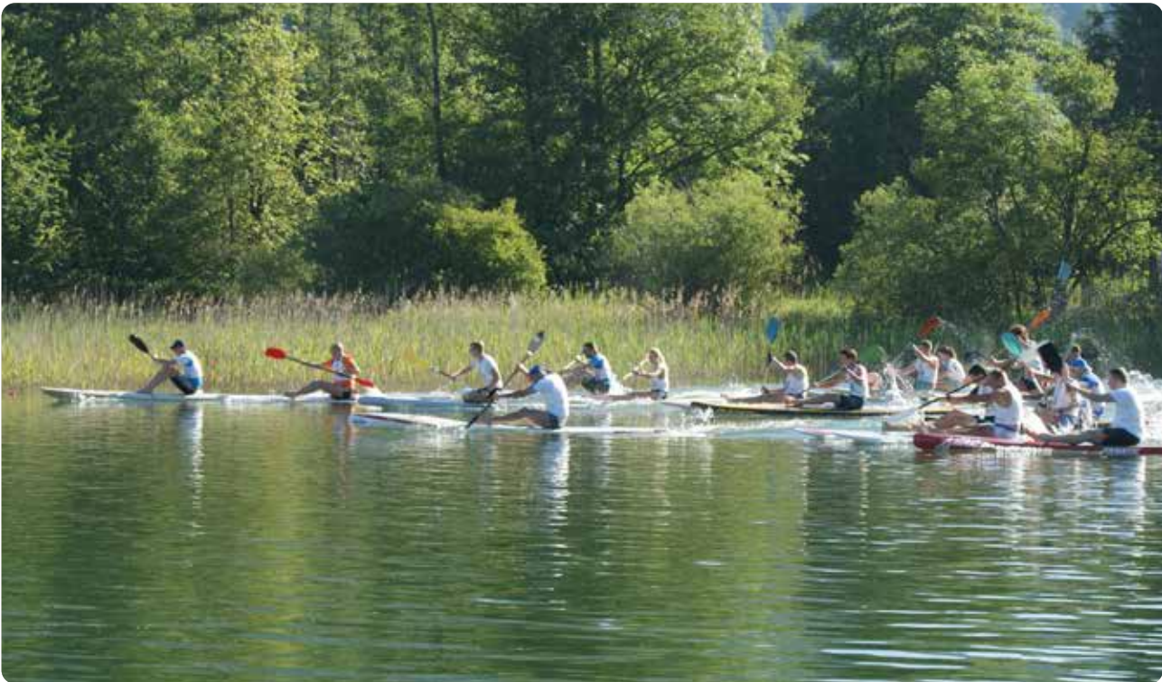
Paddeln ist die erste von vier Disziplinen beim Megathon am 9. Juni in Innerschwand.