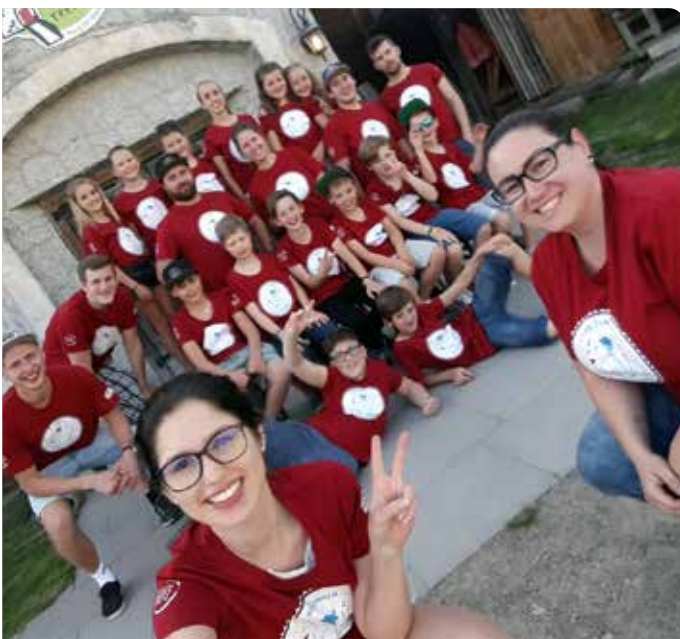
Die „Jungen Tiefgroba“ laden zum Muttertagskonzert.