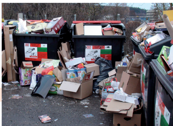
Dieses Bild gehört der Vergangenheit an.

Bei den öffentlichen Sammelinseln werden - nach der Umstellung - ALLE Sammelbehälter für Papier und Karton abgezogen .