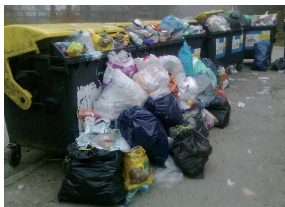
Dieses Bild gehört der Vergangenheit an.

Impressum: Eigentümer und Herausgeber: Bezirksabfallverband Vöcklabruck, Vorstadt 2, 4840 Vöcklabruck Für den Inhalt verantwortlich: Bezirksabfallverband Vöcklabruck, Tel. 07672/28477, Fax -4, voecklabruck@bav.at www.umweltprofis.at/voecklabruck